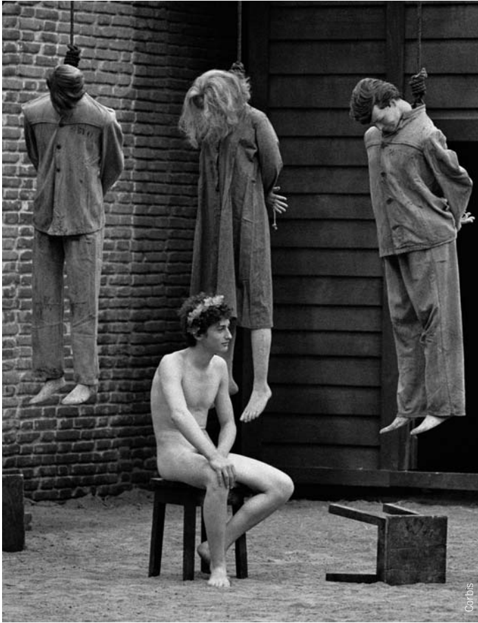
_Una scena dall'ultimo film scritto e diretto da Pasolini: Salò o le 120 giornate di Sodoma . Pasolini fu ucciso prima di poterne terminare il montaggio

stessi: la violenza, alcuni grandi miti come quelli di Stalin e di Mao, la logica del tutto contro tutti... È stato l'insorgere di un movimento di tipo fascista. Che si ammantava di ideologie di sinistra, ma che nei comportamenti si configurava come prettamente fascista. È stato come un landscape ideologico per nascondere le azioni, una ventata di attualismo gentiliano (dal filosofo Giovanni Gentile, ndr) che ha catturato i figli dei ricchi. Tutto questo si è incrociato con le sofferenze della classe operaia. E le sofferenze degli operai in quegli anni erano del tutto tangibili: se vivevi a Torino negli anni Sessanta, magari a due chilometri da Mirafiori, ogni tanto sentivi la terra tremare come in un terremoto: tum, tum, tum... erano le presse. Gli operai vivevano effettivamente in condizioni semischiavistiche, salvo che nell'impresa pubblica.